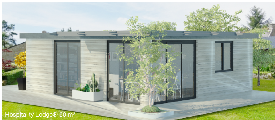
Hospitality Lodge® 60 m 2