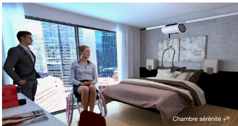
Chambre sérénité + ®

De plus, le concept de la chambre "sérénité+ ® " est une chambre PMR unique au monde qui peut être proposée dans une des chambres PMR. Ce concept a remporté le prestigieux Gold Winner lors des Architecture & Design Collection Awards 2022. Cette chambre offre un confort d'accessibilité unique au monde pour les personnes à mobilité réduite. Imaginez-vous, depuis leur lit, les occupants peuvent être transférés sans effort vers la salle d'eau, les toilettes lavant et le siège de douche fixé au mur.