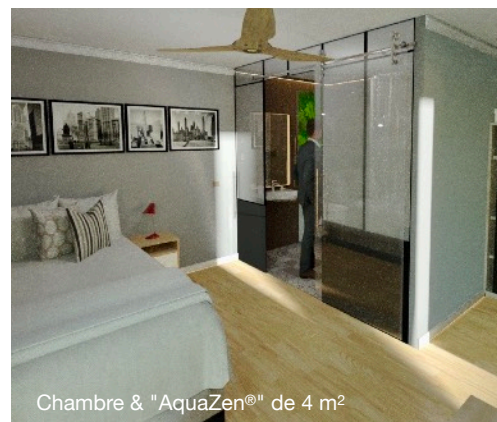
Chambre & "AquaZen®" de 4 m 2

15 m 2 . Ce concept permet d'augmenter le nombre de chambres pour une clientèle qui ne souhaitent pas se retrouver dans une chambre PMR et pour l'hôtelier l'assurance de fidéliser une nouvelle clientèle.